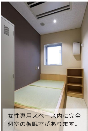
女性専用スペース内に完全個室の仮眠室があります。